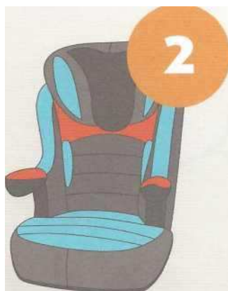
15-25 кг от 3 до 7 лет