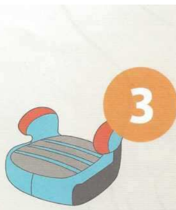
22-36 кг от 6 до 12 лет